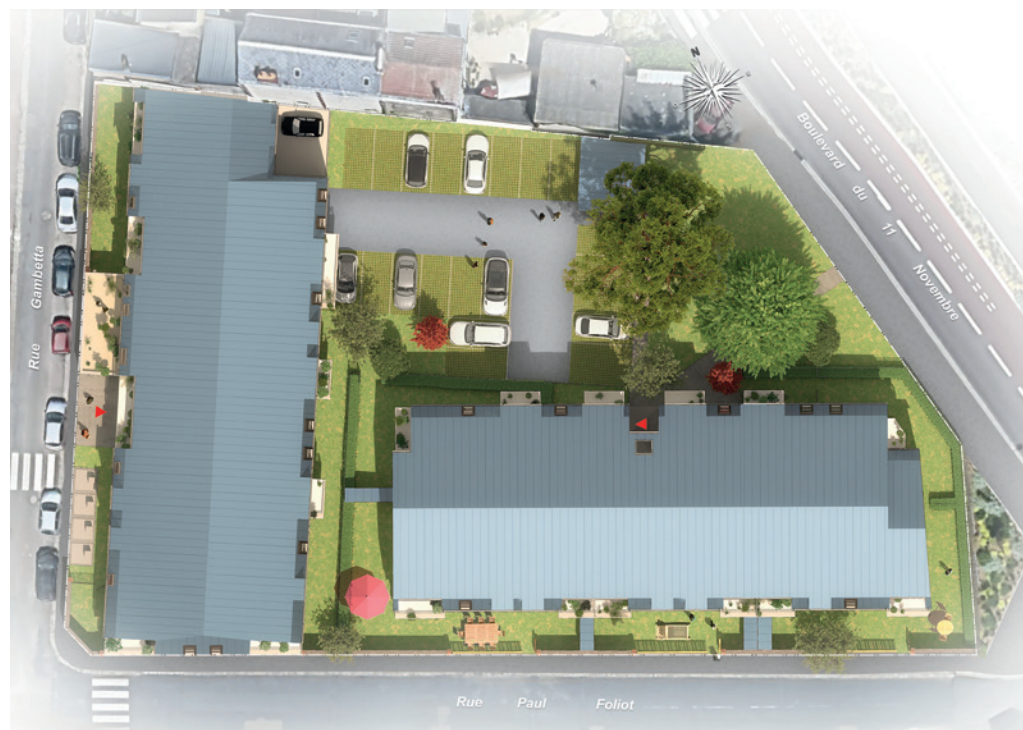
Plan masse de la résidence Calluna