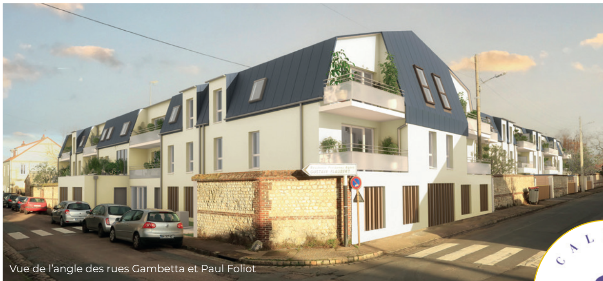
Vue de l'angle des rues Gambetta et Paul Foliot