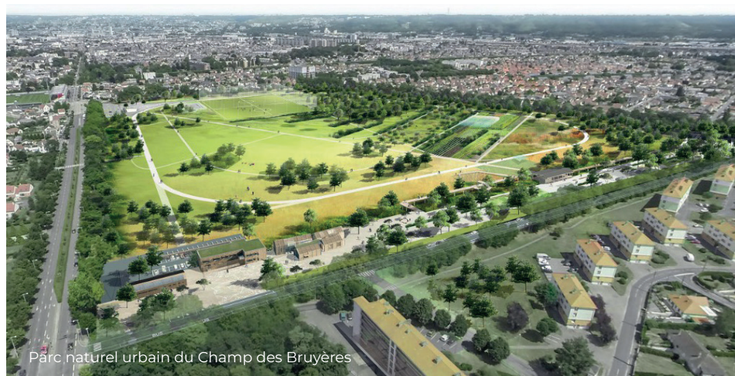
Parc naturel urbain du Champ des Bruyères

EN CŒUR DE MÉTROPOLE, nous vous proposons dans la ville du Petit-Quevilly 48 appartements dans deux villas bourgeoises. Au pied de Calluna, le boulevard du 11 novembre et le Teor qui vous conduira jusqu'au centre-ville de Rouen en moins de 10 min. Et vers le Sud, l'A13 toute proche, pour Caen, Paris ou ailleurs !