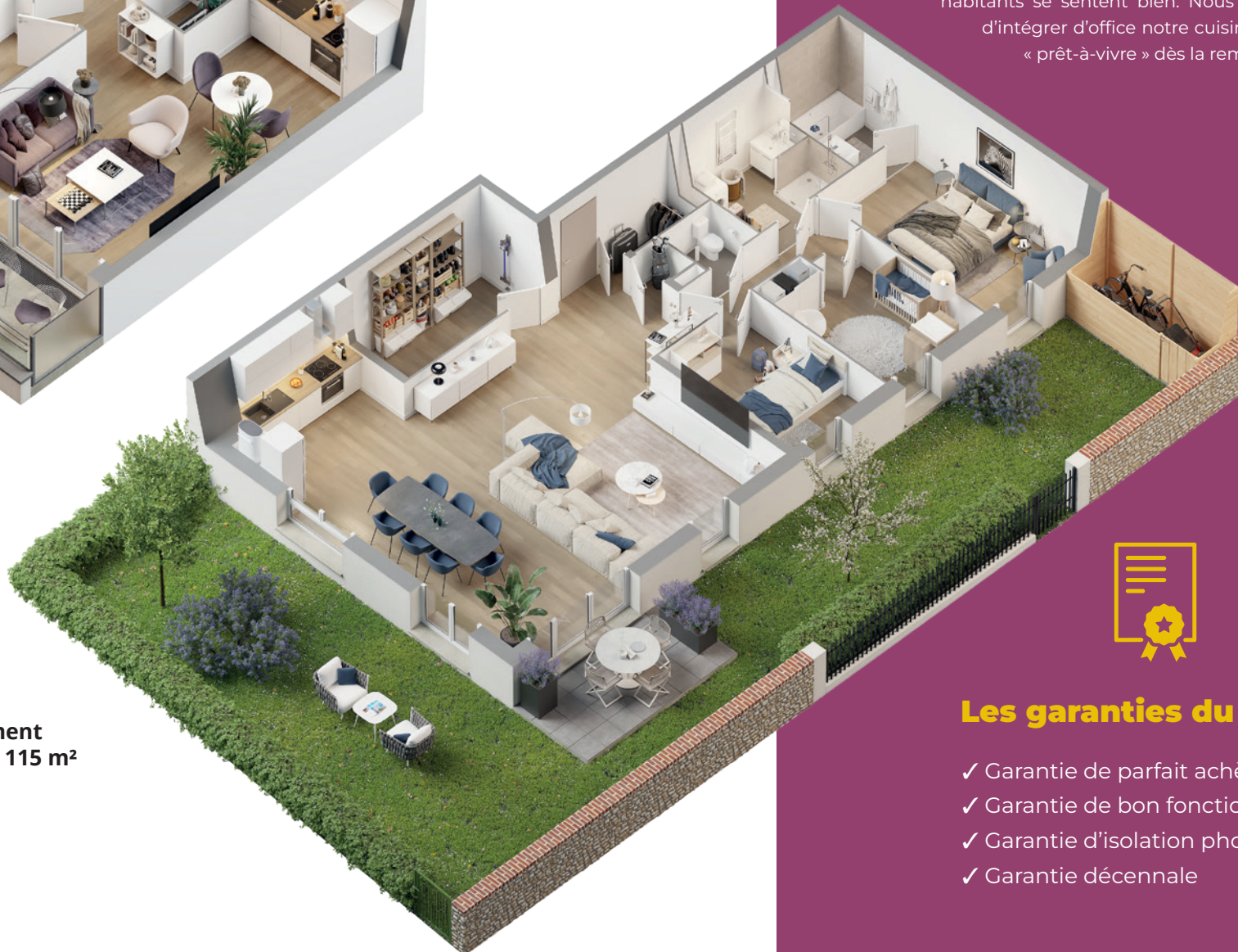
Exemple de l'appartement de 4 pièces n°2.0.05 de 115 m 2 avec terrasse et jardin