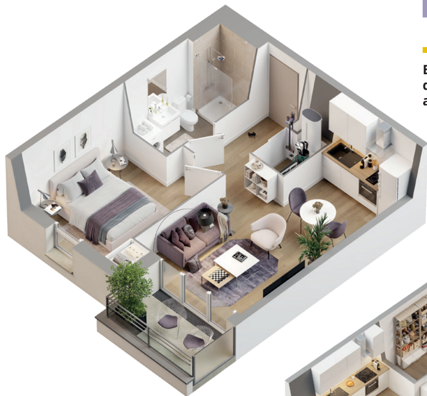
Exemple de l'appartement de 2 pièces n°2.1.06 de 38 m 2 avec balcon